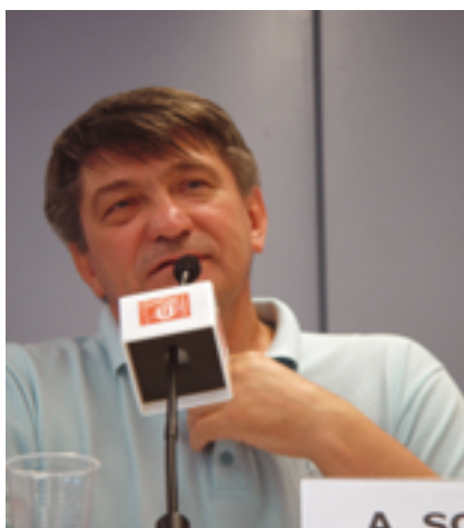
ALEKSANDR SOKUROV DURANT LA CONFERÈNCIA A LA UPF