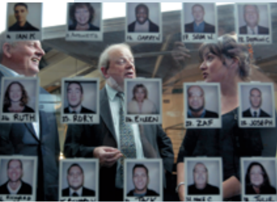
FOTOGRAMA DE VOTE FOR ME

La UPF va acollir entre el 29 de novembre i el 2 de desembre l'onzena edició del festival Miniput, que va projectar els programes més destacats i innovadors produïts al llarg de l'any per televisions públiques de tot el món, i que va tenir lloc a l'auditori de l'Institut d'Educació Contínua (IDEC).