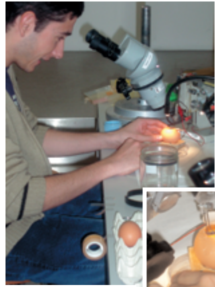
ESTUDIANT FENT UNA ELECTROPORACIÓ EN UN EMBRIÓ DE POLLASTRE

Un grup d'estudiants de disciplines biomèdiques van conèixer per primer cop tècniques de laboratori —com per exemple l'electroporació— mitjançant les quals es visualitzen complexos processos del desenvolupament del cervell dels embrions. Es va explicar com es forma el cervell en diferents tipus de vertebrats, peixos, aus i mamífers a través de la regulació de l'expressió gènica.