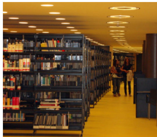
LA BIBLIOTECA DEL CAMPUS UNIVERSITARI MAR

Coincidint amb l'inici del curs acadèmic 2009-2010, s'ha acabat la primera fase de les obres de l'edifici Dr. Aiguader, que han permès que aquest espai esdevingui el Campus Universitari Mar, en el qual conviuen tres institucions docents de l'àmbit sanitari: la Facultat de Ciències de la Salut i de la Vida de la UPF, que hi imparteix els graus en Biologia Humana i Medicina (aquest darrer conjuntament amb la UAB); la Facultat de Medicina de la UAB, que ofereix el grau en Medicina, i l'Escola Universitària d'Infermeria del Mar (EUIM), un centre de l'Institut Municipal d'Assistència Sanitària (IMAS) que imparteix el grau en Infermeria (adscriu a la UPF).