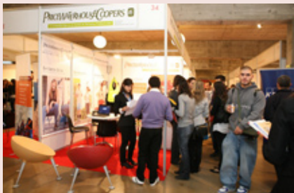
UN DELS ESTANDS D'UPFEINA

Un total de 49 estands van participar en la cinquena edició d'UPFeina, la fira d'ocupació de la UPF, que va tenir lloc els dies 18 i 19 de novembre, organitzada per l'Oficina d'Inserció Laboral (OIL) de la Universitat. Per primera vegada, la fira va estar present en el nou campus de la Comunicació - Poblenu, que va acollir empreses que treballen preferentment en el camp de les tecnologies de la informació i la comunicació (TIC).