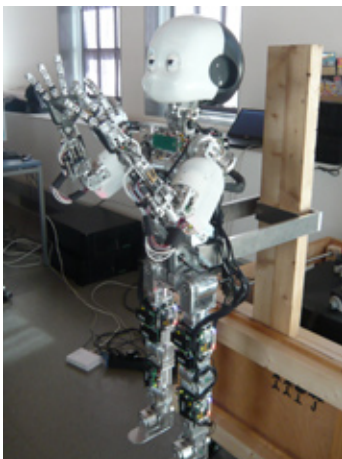
EL ROBOT ICUB

Durant la fase de desenvolupament d'aquest enginy es vol aprofundir en l'estudi dels processos d'aprenentatge humans a través de sistemes artificials, la qual cosa significa dotarlo amb nous algorismes inspirats en els processos biològics, una de les línies de recerca ja ben consolidades a SPECS.