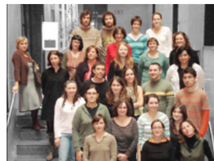
INVESTIGADORS DE L'IULA

És un primer pas, imprescindible, per poder aprovar les propostes de paraules noves, que sorgeixen especialment en els àmbits tècnic, científic, humanístic o de la comunicació social.